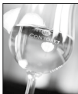
JÖNKÖPING vincontoret.se/jonkoping Tel 036-442 11 13