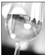
BORÅS vincontoret.se/boras Tel 033-180 98 13

Allt om utbudet på de olika orterna hittar du på www.vincontoret.se