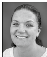
Linda Fransén Konferens och vaktmästeri