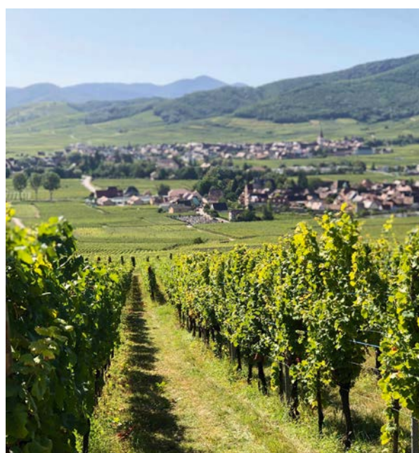
Vinodlingarna vid Wettolsheim i Alsace, strax utanför Colmar, ligger vackert utmed bergskedjan Vogesernas sluttningar.